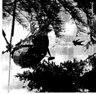
vykonáva záchranu osôb ohrozených požiarom