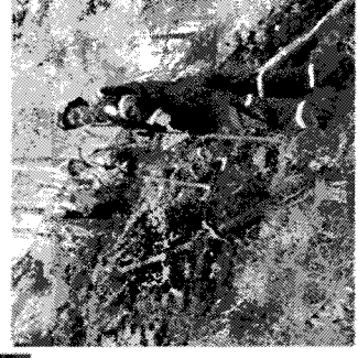
podieľa sa na likvidácii ohnísk

Fyzická osoba je povinná: dodržiavať vyznačené zákazy a plniť príkazy a pokyny týkajúce sa ochrany pred požiarom, dodržiavať zásady protipožiarnej bezpečnosti pri činnostiach spojených so zvýšeným nebezpečenstvom vzniku požiaru alebo v čase zvýšeného nebezpečenstva vzniku požiaru, oznámiť bez zbytočného odkladu príslušnému okresnému riaditeľstvu hasičského a záchranného zboru požiar, ktorý vznikol v objektoch, priestoroch alebo na veciach v jej vlastníctve, zabezpečovať pravidelné čistenie a kontrolu komínov, dodržiavať pri manipulácii s horľavými látkami a horenie podporujúcimi látkami požiadavky na protipožiarnu bezpečnosť, umožniť orgánom štátneho požiarneho dozoru vykonávanie potrebných úkonov pri zisťovaní príčin vzniku požiarov, zabezpečovať plnenie opatrení v súvislosti s ochranou lesov pred požiarom.