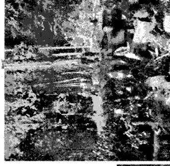
hasenie lesných požiarov patrí medzi najnáročnejšie zásahy hasičských jednotiek