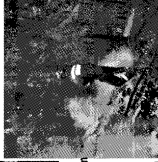
Vznik požiaru hláste na tel. číslo